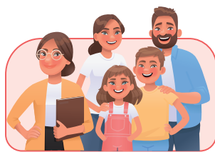
การพัฒนาครูและ ผู้ดูแลเด็กปฐมวัย (ม.23)